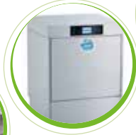
EcoTemp Spülmaschinen Mietkonzept