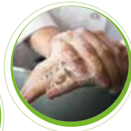
Nexa Systemlösung für die Handhygiene