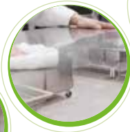
KitchenPro Systemlösungen für die Küchenhygiene