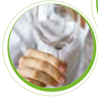
Apex™ Produktlinie in Blockform für das maschinelle Geschirrräumen

Um unseren Kunden dabei zu helfen, erfolgreich zu sein, konzentriert Ecolab sich auf die Entwicklung von Technologien ebenso wie auf seine Servicekompetenz. Die letzten Jahre waren geprägt von erfolgreichen Markteinführungen: